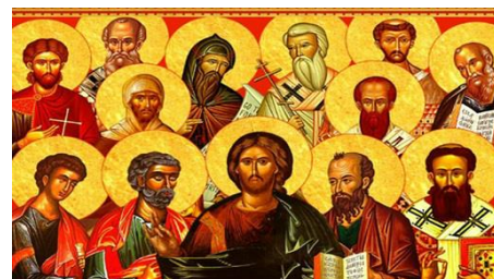
La Tradición en la Iglesia.