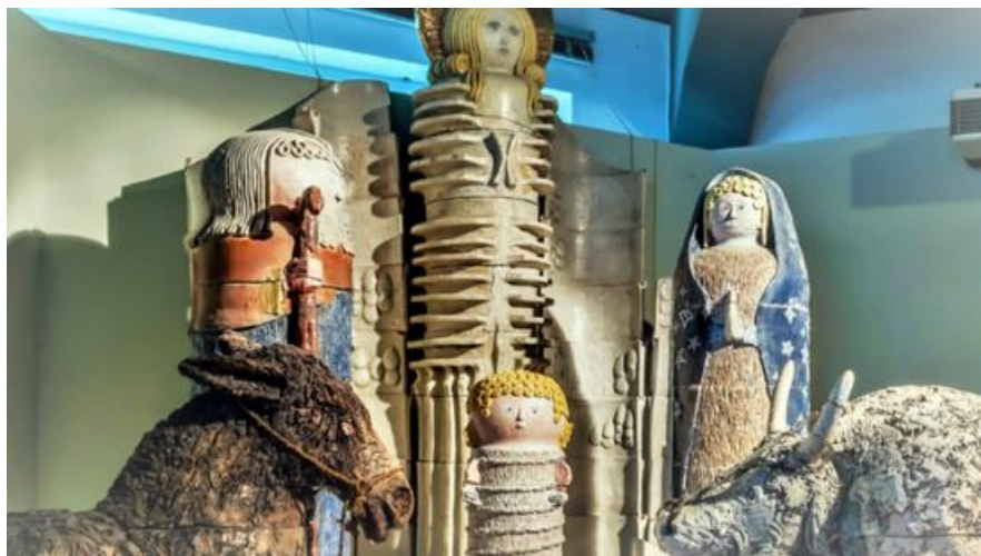
“Belén del Vaticano 2020”

Este Portal de Belén está compuesto por delicadas figuras mayores del tamaño natural, sintetizadas en formas voluptuosas pero simples: un cilindro para el cuerpo y una esfera para la cabeza, aunque son fácilmente reconocibles por los rasgos o la indumentaria.