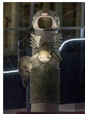
Pieza del “Belén” oficial del Vaticano

El concepto de arte en la actualidad se asocia más con la originalidad, que con el orden, la armonía o la belleza, como se definía antaño. Conceptualizado el arte en términos de originalidad, se corre el riesgo de que el producto resulte grotesco, impertinente y hasta ofensivo.