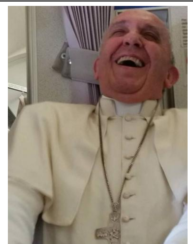
¿Una broma de Bergoglio...?

En resumen, se suprime la Misa Tradicional. Pero lo que parece una burla, es el mismo título de la Carta Apostólica: Traditionis Custodes ( Custodios de la Tradición ) pues justamente trata de lo contrario: acabar con la Tradición . Es parte de esa neolengua que utiliza la propaganda globalista, en la que usa un término para describir lo contrario; por ejemplo, “salud reproductiva”, como sinónimo de aborto; “acogida” para justificar la invasión islámica en la